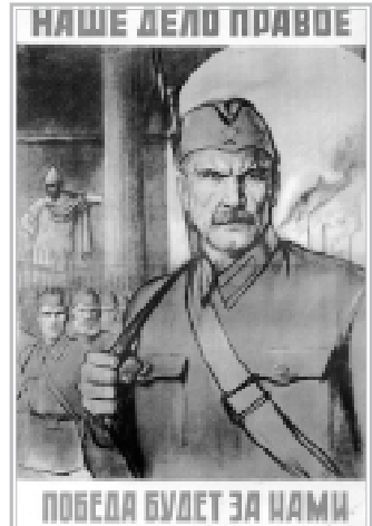
НАШЕ ДЕЛО ПРАВОЕ

Витали митинговальщи в количестве 200 человек возложили цветы к мавзолею В.И. Ленина. Число участников митинга превысило 2000 человек.