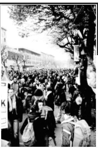
Миллионная манифестация во Флоренции против войн — в Ираке, Афганистане, Чечне — стала продолжением шестидесятитрехдневного Европейского Социального Форума. Она показала, что не только иной мир, но и иные лица — улыбающиеся, работящие и иные люди. Деловые, активные и счастливые — возможны. И не только во Флоренции!

Вырабатывается социальная конституция Европы. Причем вырабатывается она путем прямой народной демократии, включая сбор предложений по странам и городам. Уже принят принцип минимальной заработной платы, общей для всей Европы.